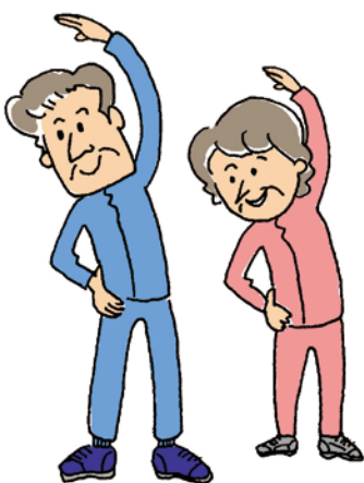
歩き始め、終わりは軽くストレッチをしましょう。