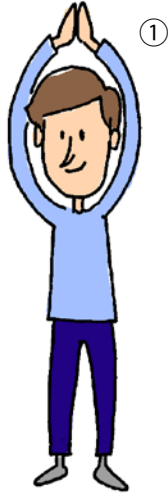
C. 両手をしっかり上に伸ばし手のひらを合わせます。(① 3~5秒キープ) 手のひらを外に向け腕を肩の高さに降ろします。(② 3~5秒キープ) そのまま腕を後方に引き両肩甲骨をくっつけるように。(③ 3~5秒キープ)