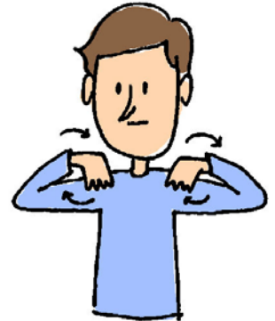
A. 肩に指を置いて肩まわし。ただし、意識は肩甲骨がよく動いているかどうか。

そこで今回は、姿勢を正して、肩甲骨周辺の筋肉を緩めながら鍛え、ダイエットをしながら肩こりも解消するというエクササイズを紹介します。 「姿勢を正して」というのが大前提になりますから、しっかりと姿勢を意識してください。