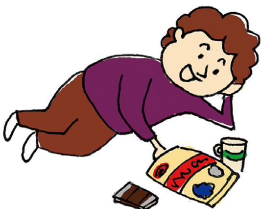
運動もせずに食べてばかりだと・・・

ポイントは2つ「量と時」です。「量」に関しては「腹八分目」という素晴らしい言葉があります。「空腹こそが最高の料理」これに尽きるといえます。限られた誌面ですのでこれ以上は書きませんが、この習慣