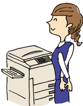
仕事のチョットした時間でもストレッチができますよ。

「快眠・快便・快食」の理解を深めても実践が無ければ何の意味もありません。そして、この3つを上手に進めて行くのが運動です。特別な運動を探すよりも、手軽にできる運動を長く続けることです。普段の生活の中に、ほんの少しの時間、ストレッチをしたり筋肉を引き締める軽運動を取り入れる工夫をしましょう。